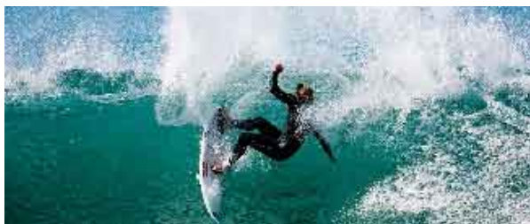
A Robertson/Tourism Australia